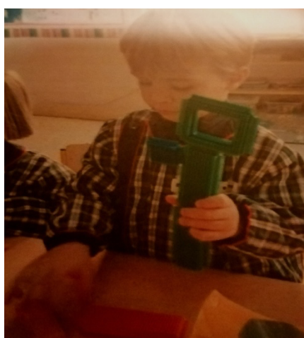
Figura 03 b.

Esta situação faz-me refletir sobre a forma como a criança aprende. Muitas vezes a educadora pode planificar situações que permitam ao grupo de crianças envolver-se na aprendizagem. No entanto, é através das suas escolhas, das suas ações que melhor compreendemos os interesses e as vontades em aprofundar um assunto.