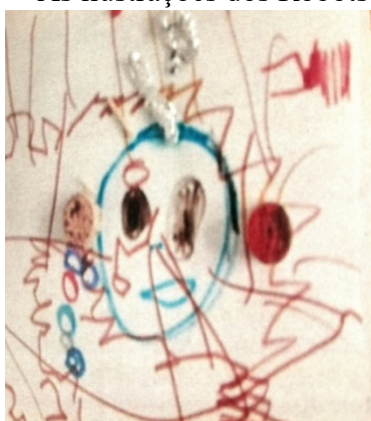
Figura 02 a.