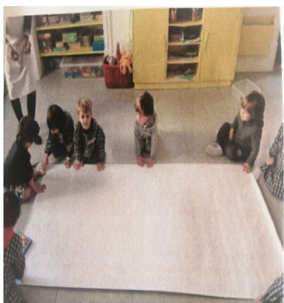
Figura 01 a.