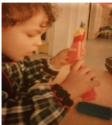
Figura 03 a.

Mesmo quando as crianças brincavam livremente na sala registei uma outra situação recorrendo ao registo fotográfico que evidenciou o seu interesse pelos robots.