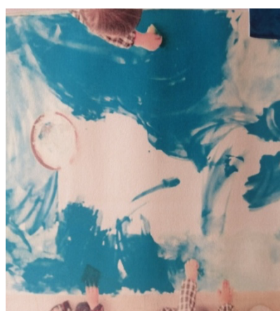
Figura 01 b.

A maioria das crianças esteve motivada a explorar a atividade, talvez porque foi realizada no chão.