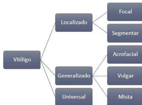
Figura 1. Classificação do Vitiligo (Araújo, 2019)

Verificou-se que grande parte dos estudos (70%) utilizou a classificação do vitiligo encontrado no estudo nº19, isto é, segundo Steiner; Bedin; Moraes; Villas & Steiner (2004) a doença pode ser classificada em “localizada”, “generalizada” e “universal”. O vitiligo localizado está dividido nos subtipos “focal” onde há presença de uma ou mais manchas em uma determinada área sem uma distribuição específica e o “segmentar” na qual há presença de uma ou mais manchas envolvendo um segmento unilateral do corpo. Enquanto que o vitiligo generalizado está subdividido em “acrofacial” na qual há presença de lesões típicas na parte distal das extremidades e face; a “vulgar” na qual há manchas com ausência de pigmentação com distribuição aleatória e a “mista” que é a junção da acrofacial com a vulgar. O vitiligo universal é a despigmentação de mais de 50% da pele ou mucosa. Esta classificação pode ser melhor visualizada nas Figuras 1 e 2 a seguir: