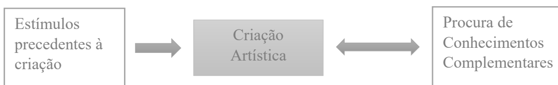
Figura 3. Relação dos Constituintes Essenciais da Estrutura A e B