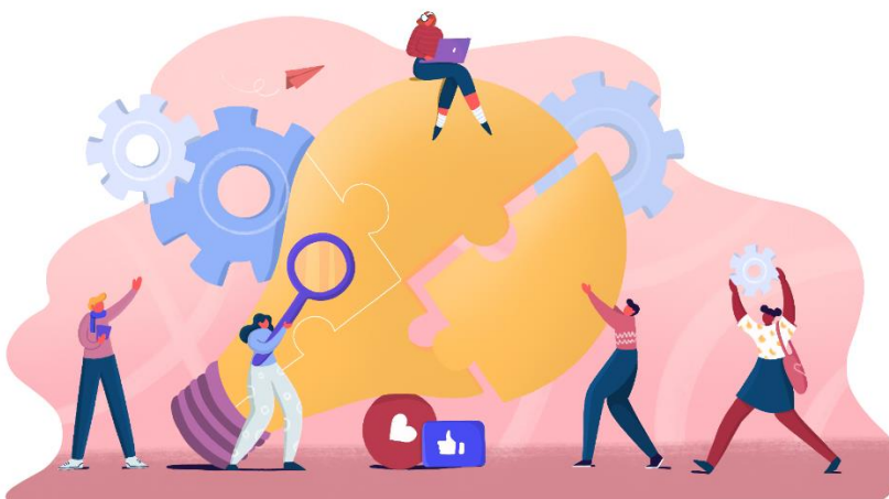
Figura 1. Imagem do Projeto LITERACIA DA INFORMAÇÃO E PENSAMENTO CRÍTICO NO ENSINO SUPERIOR: COMBATER A DESINFORMAÇÃO.

Dezembro/2021. A primeira divulgação do Projeto através da newsletter da BAD ( https://noticia.bad.pt/2021/12/03/literacia-da-informacao-e-pensamento-critico-no-ensino-superior-combater-a-desinformacao/ ).