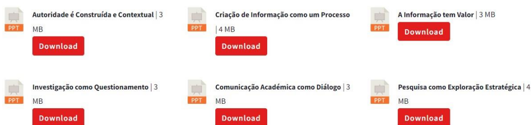
Figura 3. Powerpoints abertos e adaptáveis para formação.

Novembro/2022. Divulgação do Projeto na Região Autónoma dos Açores. Formação com bibliotecários e estudantes na Universidade dos Açores e ainda apresentação de uma comunicação oral na Biblioteca Pública e Arquivo Regional de Ponta Delgada, enquadrada no XIX Encontro Regional da Delegação Açores BAD ( https://eventos.bad.pt/event/xix-encontro-regional-bad-acoresh/ ).