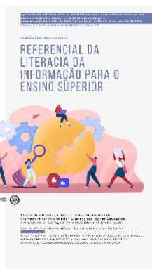
Figura 4. REFERENCIAL DA LITERACIA DA INFORMACAO PARA O ENSINO SUPERIOR – tradução oficial da Framework.

oficial pela ACRL e foi integrada no website da ACRL ( https://www.ala.org/acrl/standards/ilframework ).