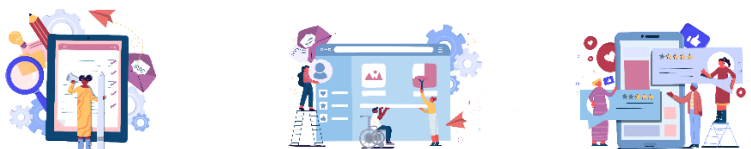
Figura 2. Algumas imagens criadas.

Junho/2022. Disponibilização de materiais promocionais para download ( https://bad.pt/formacao/projetos/combater_desinformacao/ ) (Figura 2).