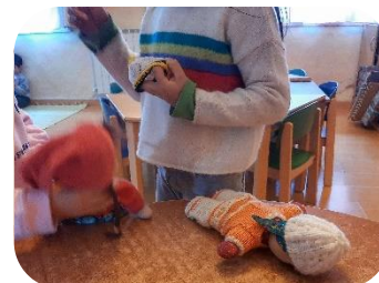
Figura 18 Trocar a roupa dos bonecos.

A educadora ia dobrando as peças de verão que estavam no guarda-roupa da casinha enquanto a L. tirava a roupa que os bebés tinham vestido e a M. e a C. exploravam as peças mais quentes que estavam no cesto (Figura 18). Ao mesmo tempo que iam conversando