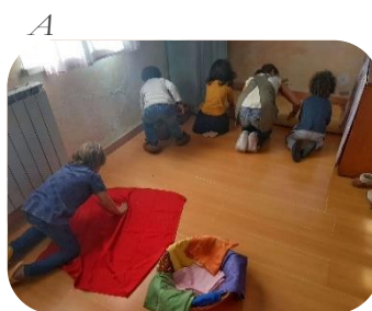
Figura 10 Arrumação da sala.

O grupo manteve o interesse por mais um tempo e, por volta das 10h20, quando algumas crianças começaram a demonstrar cansaço – a agirem de forma mais irrequieta perturbando brincadeira dos amigos ou saindo e entrando nas interações, etc. – a educadora começou a cantar a canção de arrumar – “ Tronquinhos nos cestos/ Casinha arrumada/ Assim nossa casa / Tão linda que fica / Os panos vermelhos/ Azuis, amarelos/ Todos dobradinhos/ Dormem no cestinho/ Assim a nossa casa/ Tão linda que fica ” (Pautas E em anexo). A auxiliar e eu acompanhámos a canção e, cada uma num local diferente da sala foi cantando e arrumando. Ao ouvir a canção e acompanhando os movimentos dos adultos, o grupo juntou-se na tarefa comum de colocar tudo no sítio. Em poucos minutos a sala ficou com os brinquedos nos cestos, a casinha fica fechada, os tapetes enrolados junto à parede e os móveis e mesas encostados nas laterais da sala (Figura 10). No centro da sala fica disponível um espaço relativamente grande que permite, após a partilha da fruta, a realização da Roda Rítmica.