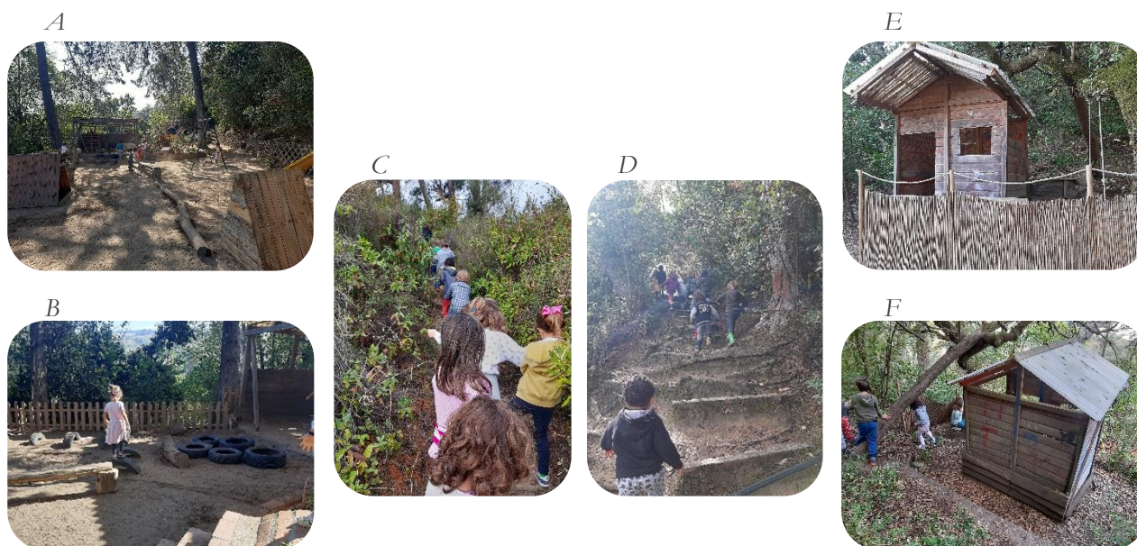
Figura 6 Espaços exteriores.

Nota: A – Jardim grande; B – Brincadeiras no jardim grande; C – Caminho para o monte; D – Caminho para o monte;