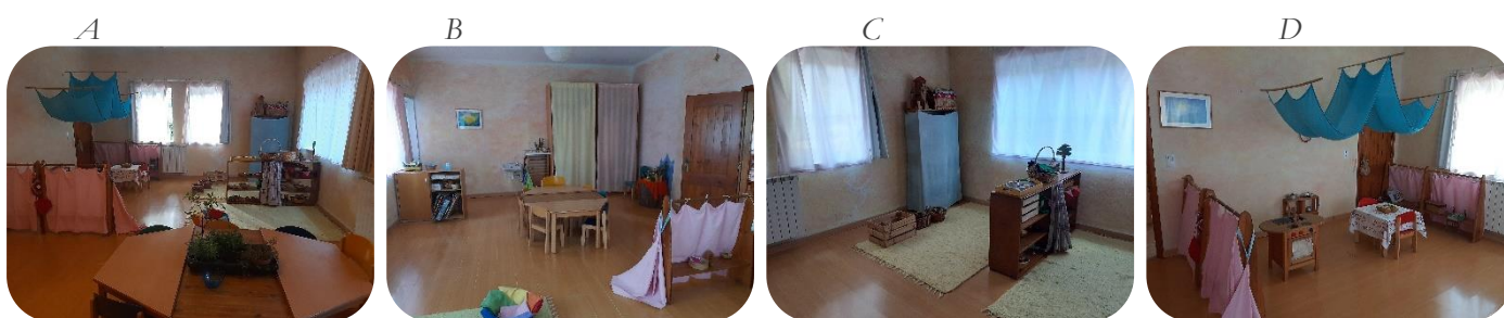
Figura 2 Organização espacial da sala

Nota: A – Organização espacial da sala (1); B – Organização espacial da sala (2); C – Área do tapete; D – Área da casinha.