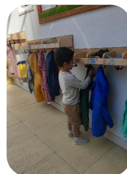
Figura 1 Área dos cabides.

A sala é espaçosa e oferece um ambiente familiar com recantos confortáveis que, unindo a utilidade à estética, possibilitam a alternância entre brincadeira íntima e brincadeira com mais interações sociais. As paredes pintadas com a técnica de lasure em tom pastel rosado, o piso de madeira e os tapetes que cobrem o chão, as cortinas que suavemente permitem entrar a luz natural e os brinquedos não estruturados que, de materiais naturais de texturas sensorialmente ricas, estão dispostos de forma cativante e atrativa, visam gerar a sensação de segurança e acolhimento, encorajando a criança a brincar e a socializar.