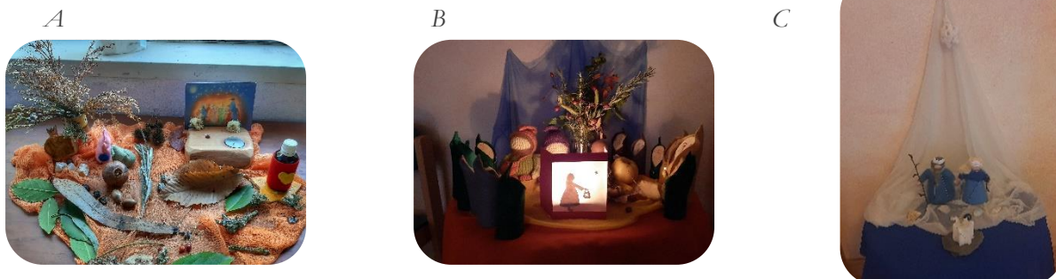
Figura 3 Mesas de Estação

Nota: A – Mesa de outono na área dos troncos construída com a participação das crianças; B – Mesa de estação da Festa das Lanternas na sala; C – Mesa de inverno na sala