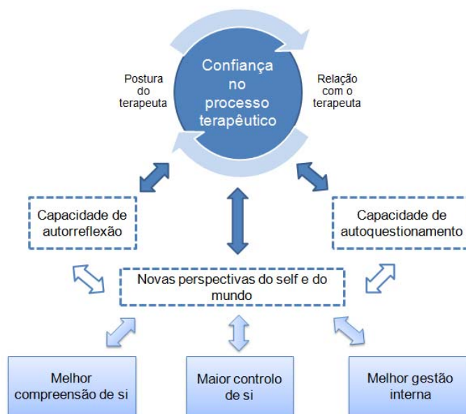
Figura 2. Estrutura final dos quatro participantes: PD1, PD3, PE2 e PJ1.