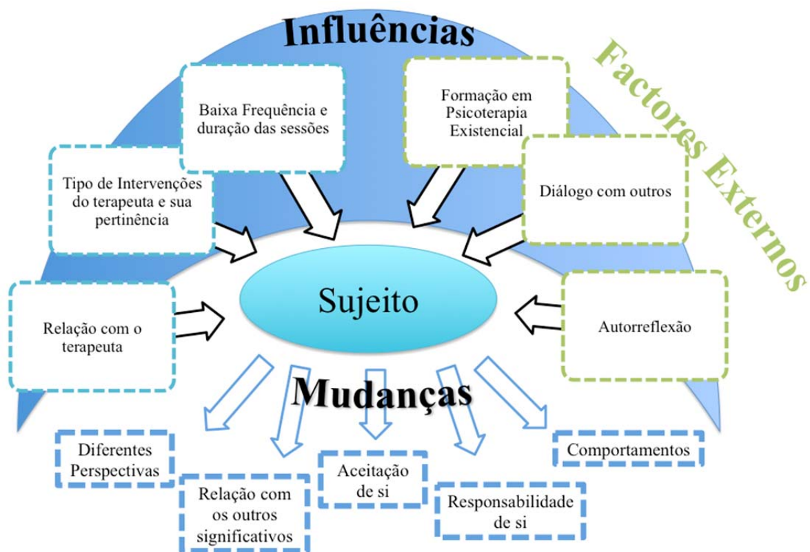
Figura 1 – Unidades de Significado Psicológico de PE2