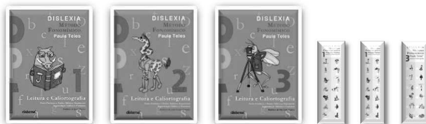
Figura 4 – Livros de Leitura e Caligrafia 1,2,3

Livros de Leitura e Caligrafia 1,2,3 – São um conjunto de 3 livros cuja elaboração obedeceu a critérios rigorosamente definidos: