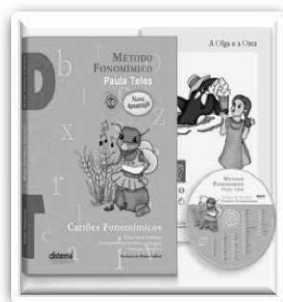
Figura 1 – Cartões Fonomímicos

Cartões Fonomímicos – Constam dos Cartões Fonomímico, um CD, que contém “Cantilenas do Abecedário” e dos casos especiais de leitura. Ensinam as correspondências fonema \Leftrightarrow grafema e os grafemas complexos. As letras vogais são apresentadas por cinco amigos alegres, curiosos e brincalhões: a Inês, o Ulisses, a Olga, a Aida e o Egas. As letras consoantes são apresentadas por animais. Cada “Animal-Fonema” está associado ao grafema correspondente, a uma história-cantilena e a um gesto. Destinam-se às crianças do jardim de infância, às crianças que estão a iniciar a aprendizagem da leitura e como atividades lúdico-pedagógicas.