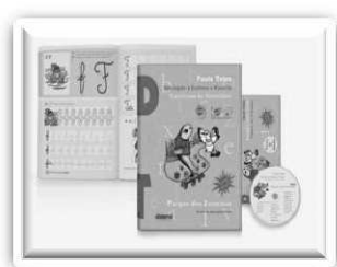
Figura 2 – Parque dos Fonemas

Cartões Fonomímicos – Constam dos Cartões Fonomímico, um CD, que contém “Cantilenas do Abecedário” e dos casos especiais de leitura. Ensinam as correspondências fonema \Leftrightarrow grafema e os grafemas complexos. As letras vogais são apresentadas por cinco amigos alegres, curiosos e brincalhões: a Inês, o Ulisses, a Olga, a Aida e o Egas. As letras consoantes são apresentadas por animais. Cada “Animal-Fonema” está associado ao grafema correspondente, a uma história-cantilena e a um gesto. Destinam-se às crianças do jardim de infância, às crianças que estão a iniciar a aprendizagem da leitura e como atividades lúdico-pedagógicas.