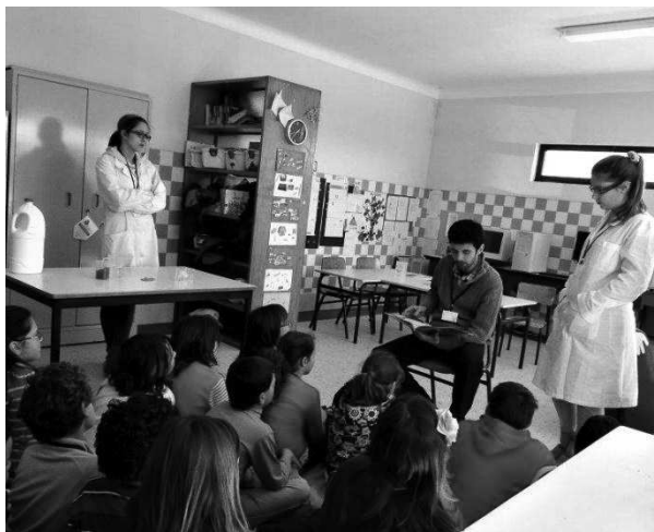
Figura 2. Atividade de leitura da história “João e o feijoeiro”, que serviu de introdução à atividade sobre os efeitos de poluentes na germinação de sementes, no espaço dedicado ao MiniLab do Valado.

Num segundo momento, os elementos do grupo apresentaram-se às crianças envolvidas, tendo de seguida apresentado o projeto e a sua mascote, o “Valado”, nome alusivo à localidade onde as crianças habitam (Figura 3). A criação da mascote teve como intenção desenvolver um sentido de identidade no grupo de crianças envolvidas.