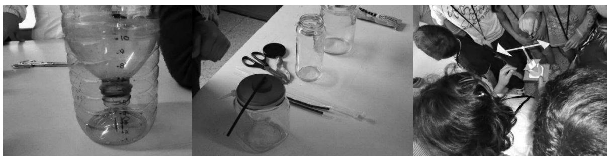
Figura 4. Construção de uma mini estação meteorológica com materiais reutilizáveis. Da esquerda para a direita: pluviómetro, barómetro e cata-vento.

Construção de Perceber como se estuda o Recorrendo a utilização de uma mini clima; materiais reutilizáveis foi estação Sensibilizar para a construída com as crianças três meteorológica reutilização de materiais; instrumentos meteorológicos \\ (barómetro, pluviómetro e cata- vento) (Figura 4).