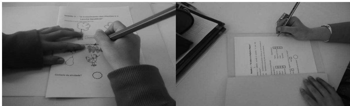
Figura 5. Inquérito a que as crianças do ensino pré-escolar (esquerda) e do 1º ciclo (direita) responderam após a implementação da atividade sobre o efeito dos poluentes na germinação das sementes e na qualidade da água.

Ainda com o intuito de monitorizar as atividades desenvolvidas foram recolhidas todas as produções escritas das crianças, e foram efetuados registos fotográficos em todas as sessões dinamizadas. Na última sessão dinamizada com as crianças foram também realizados registos em suporte vídeo, com o intuito de recolher as opiniões das crianças sobre o projeto desenvolvido.