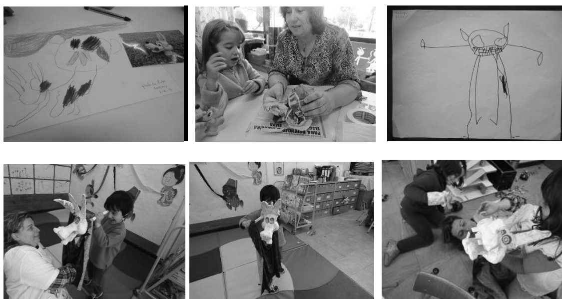
Figura 1 – Momentos do desenho da construção e experimentação do lobo mau

A escolha da história do lobo mau decorre da necessidade de trabalhar projetos de iniciativa das crianças, criando a oportunidade de experienciar sentimentos e emoções a partir das histórias que integram a personagem do lobo mau. A construção do fantoche lobo mau foi projetada em desenho e realizada através da modelagem utilizando papel de jornal e fita de papel conforme ilustra a figura seguinte.