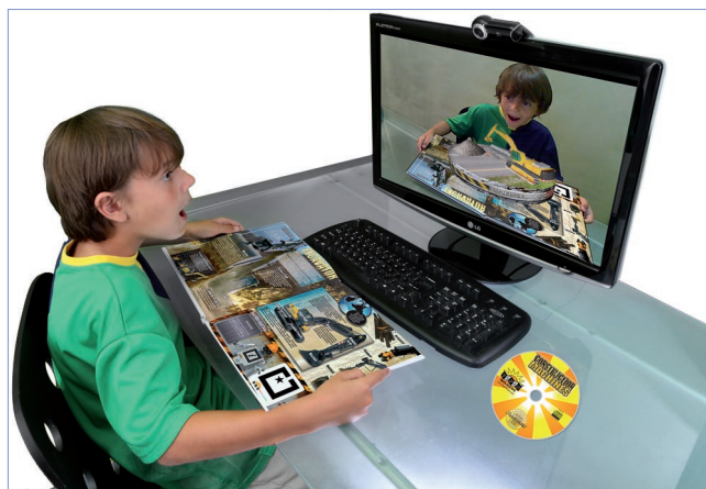
Ejemplo de lectura inmersiva.

El libro es un documento imperecedero, sometido a cambios y transforma-