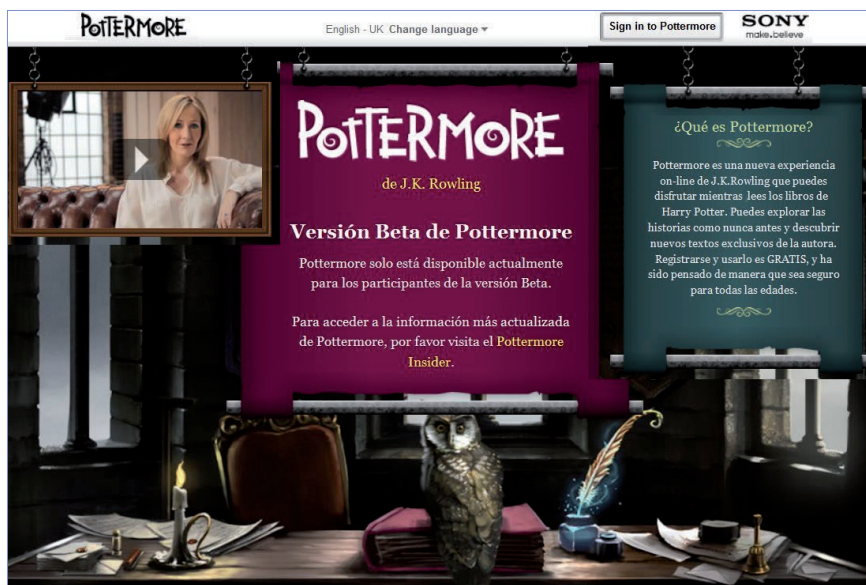
Pottermore es una web para usar mientras se leen libros de Harry Potter, http://www.pottermore.com/es

La unidad de pensamiento puede ser la frase, el párrafo, la sección o el capítulo de un libro. Pero la forma extensa, una historia, un relato unificado, una discusión completa..., ejerce una fascinación, una extraña atracción sobre nosotros. En la Red es lo mismo: podemos cortar el libro en bits y enlazarlos o tejerlos con otros, pero la organización de primer nivel del libro seguirá centrando la atención.