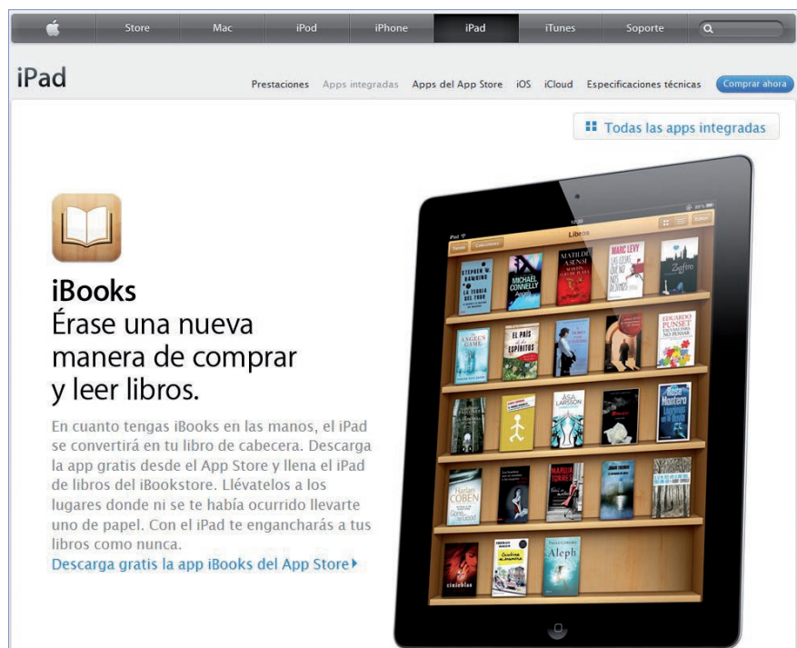
Web iBookStore de Apple, http://www.apple.com/es/ipad/built-in-apps/ibooks.html

Desde hace muchos años la edición se ha caracterizado por su tendencia a la internacionalización y a la concentración de empresas. Los grandes conglomerados editoriales tienen vocación de monopolio, y esto es un axioma para grupos pre-electrónicos como Bertelsmann , Elsevier , Hachette , Planeta , etc.