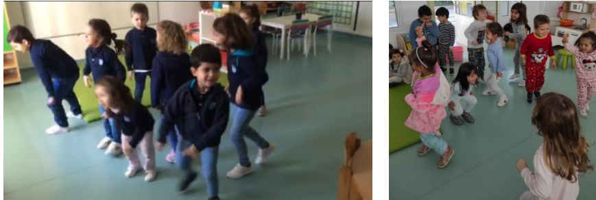
Figura 3. Momento de dança livre em sala

colocada em diferentes ambientes (sala de atividades, exterior e ginásio), de maneira a analisar se os comportamentos das crianças se modificavam de ambiente para ambiente.