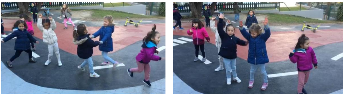
Figura 4. Momento de dança livre no exterior

Na figura 3 a dinâmica é realizada na sala. O facto de a sala não ter um espaço específico para a dança, visto ter poucos espaços desocupados, faz com que as crianças se inibam mais e ao mesmo tempo se juntem de tal forma a que os movimentos se evidenciam mais curtos e não tão livres como o desejado. O facto de os adultos sugerirem ao grupo para dançar, de certa forma, também os inibe, pois sabem que estão a ser observados o que os leva a ter alguma vergonha e receio em não estarem a fazê-lo bem, trazendo-lhes insegurança nas suas potencialidades.