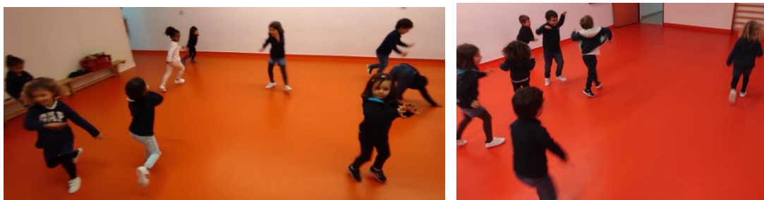
Figura 5. Momento de dança livre no ginásio

não havendo tanta preocupação em ‘falhar’. O grupo ao ter um espaço mais amplo e ao ar livre mostra-se mais confortável em explorar o corpo e a deixar-se levar pela euforia que os diferentes estilos de música oferecem a cada um à sua maneira, deixando o corpo menos tenso e mais ‘aberto’ aos diferentes sentimentos que vão sentindo ao longo da experiência. Com esta prática, as crianças desenvolvem uma maior relação com o espaço e com os outros (Silva et al., 2016).