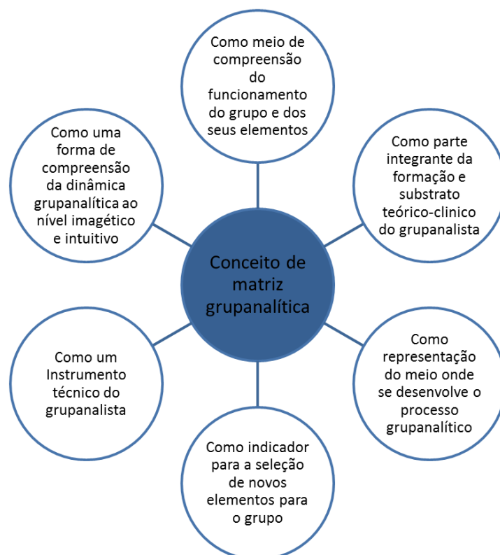
Figura 1. Elaboração esquemática das vertentes do conceito de matriz grupalítica com impacto na prática clínica.

De referir que o conceito de matriz grupalítica cumpre os objetivos inerentes às seguintes vertentes, com impacto na prática clínica, representados na seguinte figura: