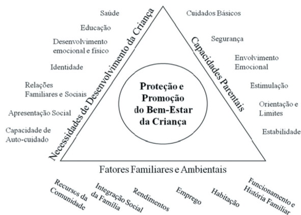
Figura 1. Pirâmide representativa do SPP (adaptado de CNPCJR, sem data).

O Sistema de Promoção e Proteção português (SPP) é um sistema de orientação, inspiração e génese comunitária. É um sistema fundado na comunidade e, como tal, as entidades com competência em matéria de infância e juventude (doravante designadas apenas por Entidades) encontram-se na base da pirâmide que o representa (Figura 1).