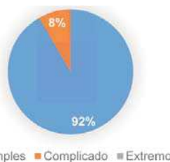
Figura 3. Índice dos tipos de lutos nos participantes

Com base na Figura 2, pode-se observar que em relação ao luto pela família, 13 pessoas apresentaram estressores simples, 8 estressores complicados e 3 estressores extremos. No luto pela Cultura, 22 entrevistados que apresentaram estressores simples e 2 estressores extremos. No tocante ao luto pelo status social, 16 sujeitos apresentaram estressores simples, 3 estressores complicados e 5 estressores extremos. Já no luto pelo grupo de pertença, 23 pessoas apresentaram estressores simples e 1 estressores complicados. Por fim, no luto pelos riscos físicos, 18 entrevistados apresentaram estressores simples e 6 estressores extremos.