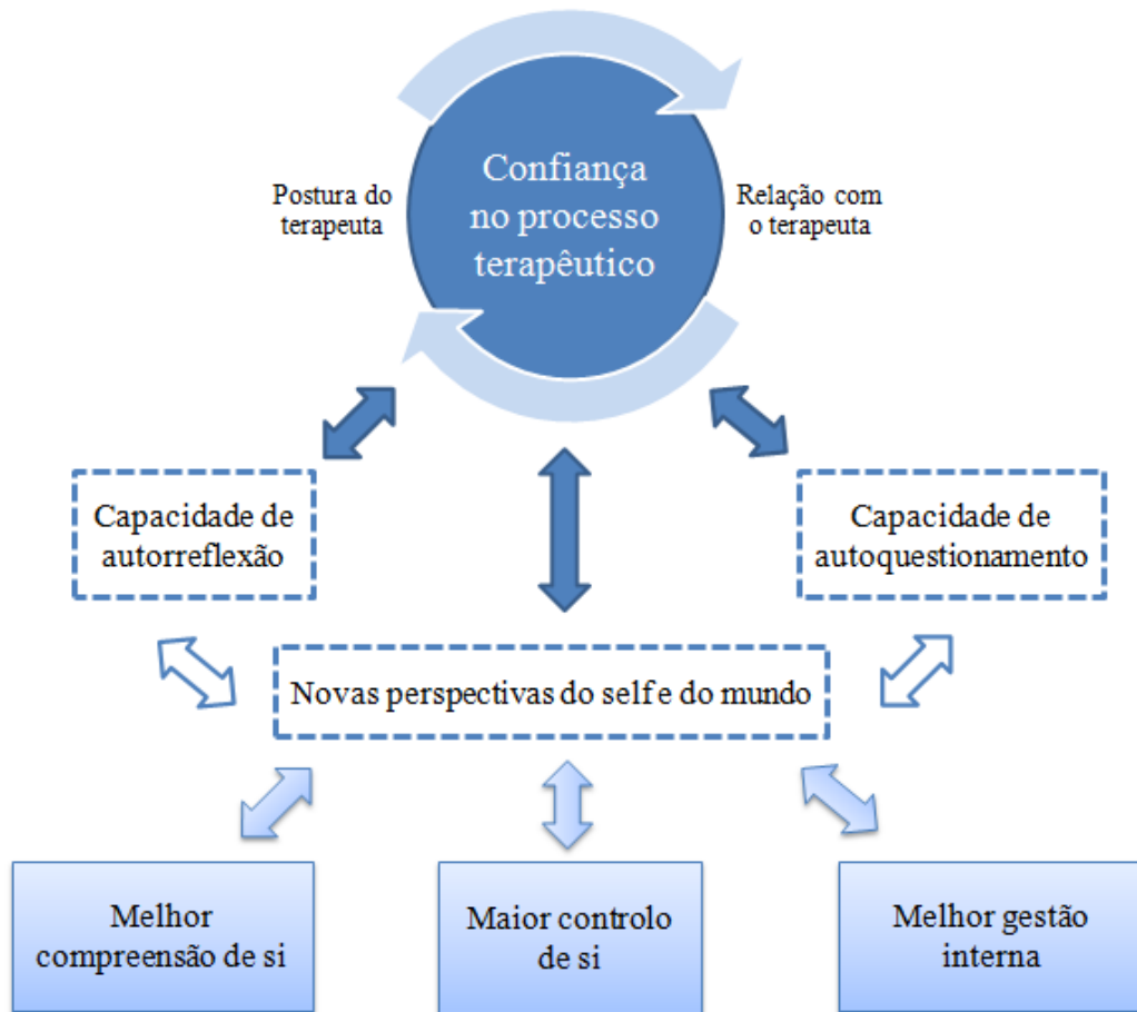
Figura 2. Relação entre os constituintes chave de PD1, PD3, PE2 e PJ1