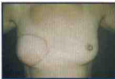
Imagem 3 – Reconstrução com músculo, gordura e pele do abdómen.