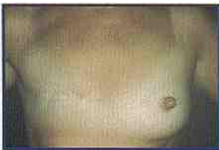
Imagem 2 – Após mastectomia do lado direito.

Reconstrução do complexo areolo-mamilar: Constitui-se na segunda etapa do processo de reconstrução mamária. Trata-se da reconstrução da região aréolo-mamilar semelhante ao lado oposto, tanto em simetria como em cor e textura.