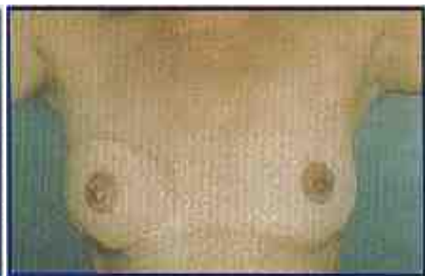
Imagem 4 – Depois da cirurgia que refez o mamilo e a aréola com tatuagem.