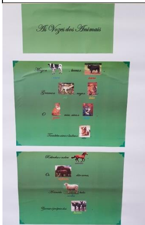
Figura 4: Lengalenga “As Vozes dos Animais”

E a S.C. concordou: - “Sim, é uma pessoa que tem vergonha das pessoas e, por isso, não quer ir ter com os amigos.”