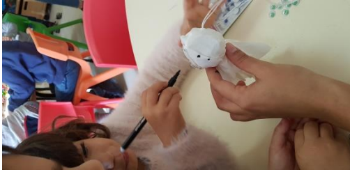
Figura 2. Atividade decoração da casa fantasma

Após a realização de algumas atividades cujo objetivo era promover a comunicação e, por conseguinte a aprendizagem entre pares, as crianças reconheceram em si a capacidade de construir a sua própria aprendizagem, tomando decisões, exprimindo as suas opiniões e justificando as suas escolhas. Tal progresso poderá ter ocorrido porque, de acordo com Guedes (2011), as crianças foram estimuladas a vivenciar situações que as desafiaram cognitivamente através do questionamento, colocação de hipóteses, experimentação e organização. Assim, se a ação de educador de infância for ajustada ao grupo é possível haver interações entre crianças da mesma idade que promovem e contribuem para um melhoramento do ritmo de ensino-aprendizagem.