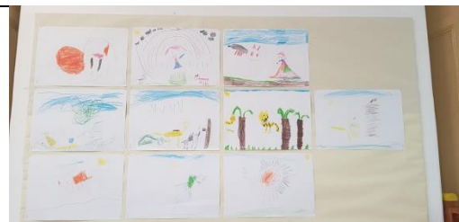
Figura 3: Atividade desenho dos felinos

Quase no final da prática supervisionada as crianças formaram pequenos grupos de quatro elementos e aquando os ensaios para os teatros apresentados ao restante grupo para finalizar o