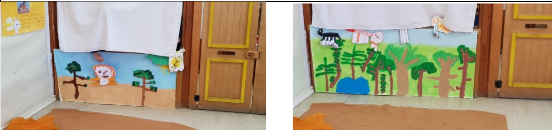
Figura 5: Teatro de varas “Os animais felinos”

- “E se fizéssemos um projeto sobre aves de rapina?”.