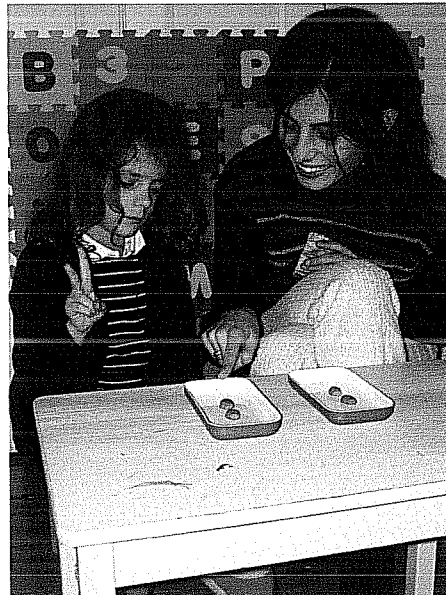
Figura 2: A investigadora pergunta à criança “quantos estão aqui?”, apontando para o tabuleiro da esquerda.