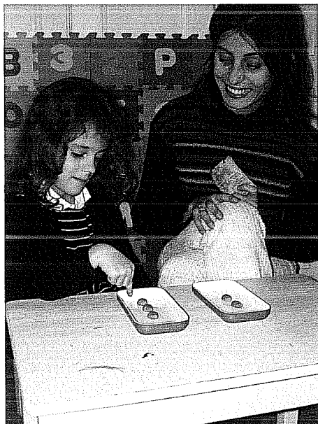
Figura 5: A resposta da criança à pergunta “qual é que tem mais?”