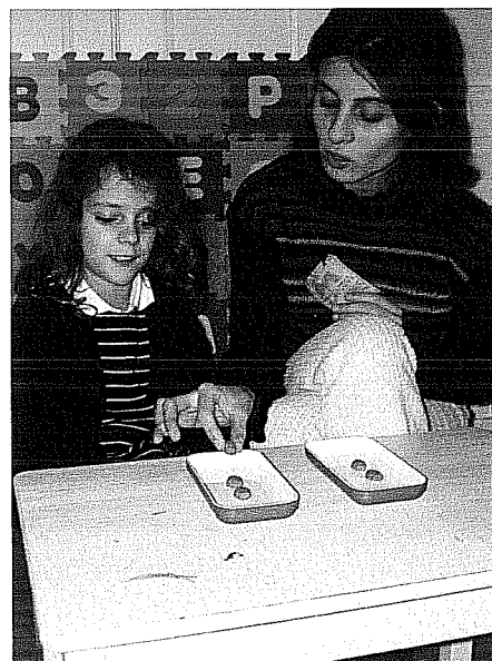
Figura 4: A investigadora acrescenta um elemento ao conjunto da direita e pergunta “E agora, qual é o que tem mais?”