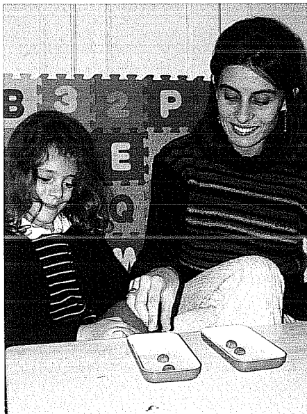
Figura 1: A investigadora coloca dois elementos em cada um dos tabuleiros (numerosidade inicial igual, na situação 1).