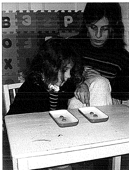
Figura 3: A investigadora pergunta à criança “quantos estão aqui?” apontando para o tabuleiro da direita.