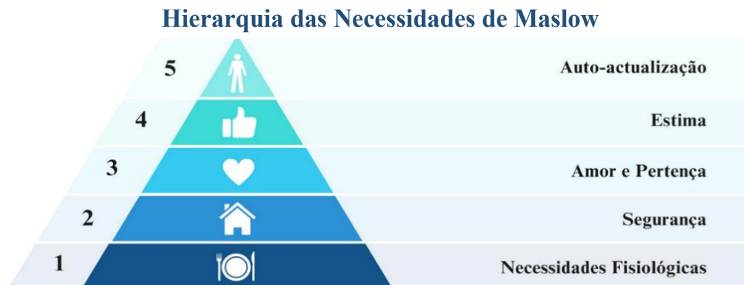
Figura 1. Representação da pirâmide proposta por Maslow (1987)

Sendo o sentimento de pertença importante no funcionamento social e psicológico do ser humano, pode-se dizer que este sentimento demonstra ser uma necessidade básica que a maioria dos seres humanos procura satisfazer (Allen, 2021). É possível compreender o sentimento de pertença como uma necessidade básica ao observar a Teoria da Hierarquia das Necessidades proposta por Maslow ((Maslow et al., 1987) cit in Allen, 2021) (Figura 1). Nesta teoria, conseguimos compreender que a necessidade de amor e pertença emergem na pirâmide das necessidades logo após as necessidades fisiológicas e de segurança serem asseguradas. Isto demonstra que, a necessidade de pertença, é um elemento importante não só para o sentimento de satisfação do sujeito, como também serve de base para suprir as posteriores necessidades sentidas pelo ser humano, tais como as necessidades a nível da estima (autoestima, confiança, respeito) e ainda as necessidades de realização pessoal (moralidade, criatividade, espontaneidade, etc.) (Allen, 2021; Desmet & Fokkinga, 2020).