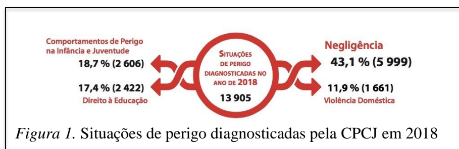
Figura 1. Situações de perigo sinalizadas pela CPCJ no ano de 2018.

Mesmo existindo na literatura estudos que mostram uma relação importante entre a exposição à violência doméstica, saúde mental e delinquência, o tema permanece de extrema importância, pois os níveis de violência doméstica tendem a aumentar e, consecutivamente, cada vez mais crianças assistem a esta violência. Em 2018, foram comunicadas às CPCJ 13,950 situações de perigo. As situações primordiais, incluem a negligência com 43.1% das comunicações e, a exposição a violência doméstica com 11.9% (CNPDPJCJ, 2019). Para uma análise detalhada, consultar a figura 1.