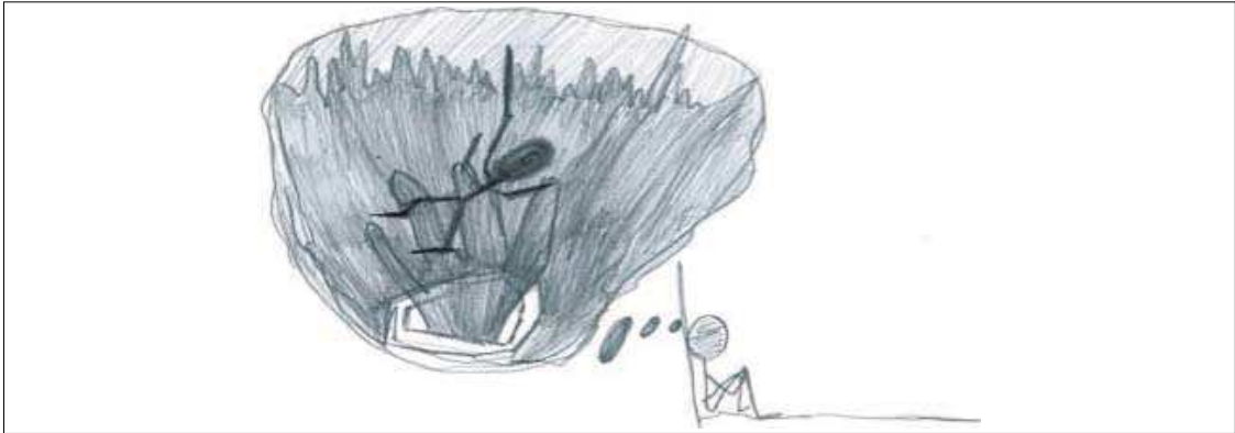
Figura 3. Representação gráfica de um jovem de 15 anos acerca do medo de morrer

Dado o processo de maturação de que o adolescente é sujeito, é crescente a tomada de consciência da finitude da vida. Simultaneamente neste processo evolutivo os jovens pensam sobre o sentido da vida e, por conseguinte, na morte e no suicídio. Neste estudo os jovens representam mais a visão da morte como algo natural no desenvolvimento humano, ou seja, como facto universal e inevitável (Figura 4). Segundo Kovács (2008) e Rodriguez e Kovács (2005) na adolescência, a morte é pensada como impedimento da realização de sonhos e da concretização de objetivos, os quais são inerentes à fase de desenvolvimento que o adolescente se encontra, onde tudo acontece e está a ser construído.