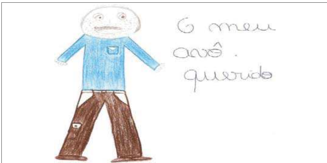
Figura 1. Crianças de 10 anos que perdeu o avô

O tema mais figurado pelas crianças relaciona-se com a morte de um familiar ou animal de estimação. Na Figura 1 podemos observar um desenho de um menino de 10 anos que representou a seu avô dizendo que tem muitas saudades dele e que ele é um querido. Louzette e Gatti (2007) explicam que perder alguém significativo implica a necessidade de adaptação a viver sem ela, e, para a criança, a perda de uma figura de referência influencia o seu desenvolvimento. Estas influências podem ser a nível social, emocional, comportamental levando a criança a acreditar que só ela perdeu um ente querido.