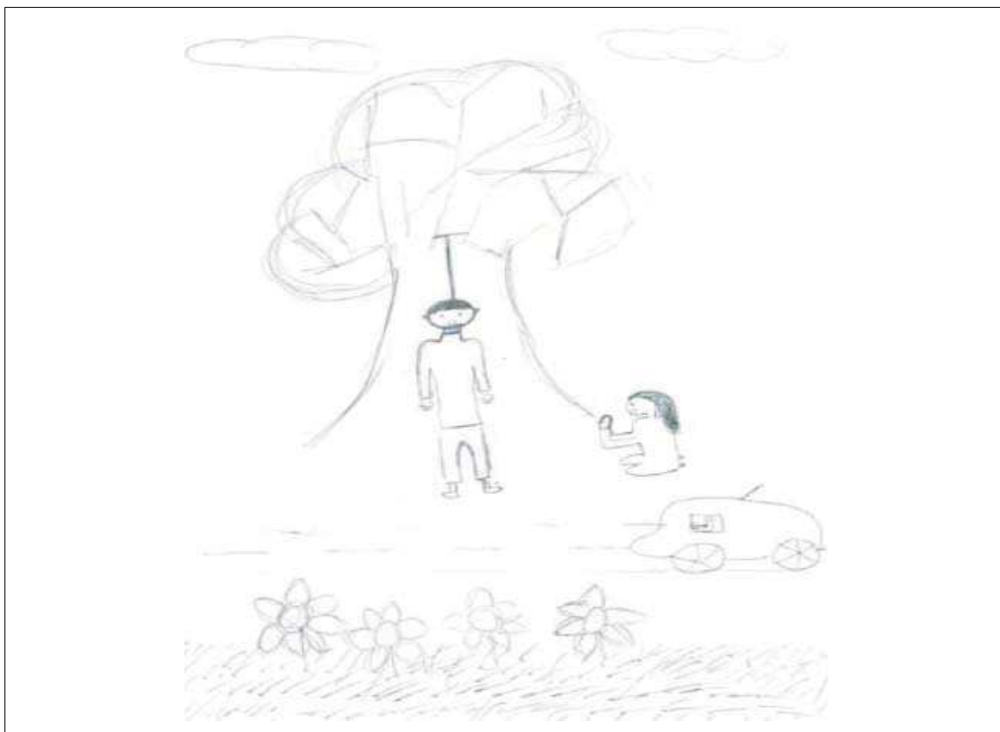
Figura 5. Representação gráfica de uma jovem de 14 anos acerca do suicídio

um conjunto de pensamentos, motivações e acções cujo intuito é o de pôr termo à própria vida, ou seja, implica uma autoagressão intencional com o fim de provocar a morte.